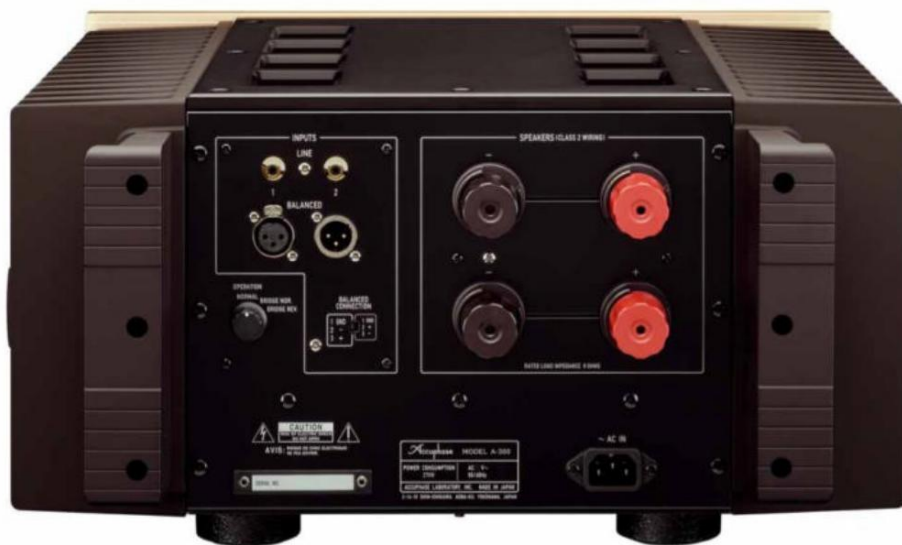
Панель подключения предлагает все, что пожелает сердце аудиофила.

с чем сравнивается шум Предшественник снова уменьшился. Accuphase называет это «двойным кратным током» . Напевая. В принципе должно быть возможно сможете переконфигурировать этот усилитель мощности в стерео версию с минимальными изменениями. Внимательный взгляд на рекламный проспект новенького A-80 подтверждает это. Кстати, догадки. В противном случае у вас есть все снова в конце были сделаны небольшие улучшения. Accuphase больше не включает выходные сигналы усилителя. реле, но с малыми потерями и неизнашиваемыми МОП-транзисторами. Здесь вы начнете типы с еще более низким импедансом, что Коэффициент демпфирования устройства снова Улучшился. Блок питания развернулся на 180 градусов. В то время как в