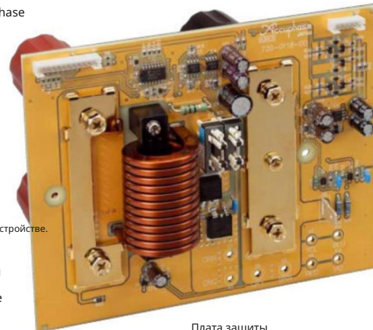
Плата защиты работает с очень низким импедансом MosFets и воздушная катушка с плоским проводом

в основном полноценные усилители мощности построены, выходы из которых находятся только на Разъемы динамиков собраны вместе становятся. Последним воплощением этой идеи являются усилители напряжения. переключал на платы усилителя мощности, вот так что они тоже теперь существуют дважды