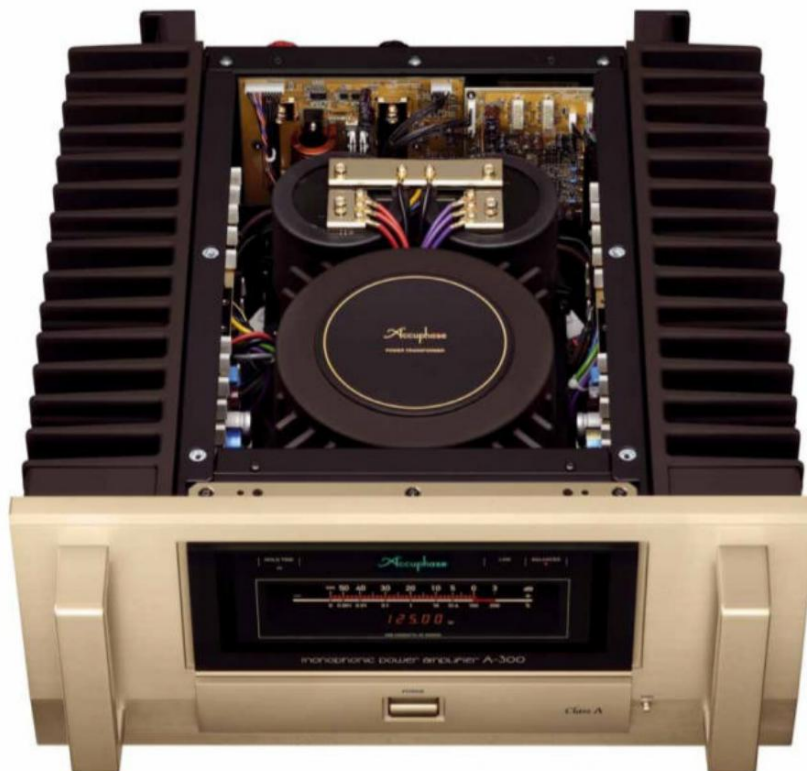
Сетевой трансформатор новой топ-модели другой к A-250 в передней части корпуса